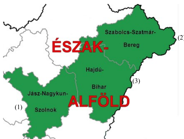
1. ábra: Az Észak-Alföldi régió