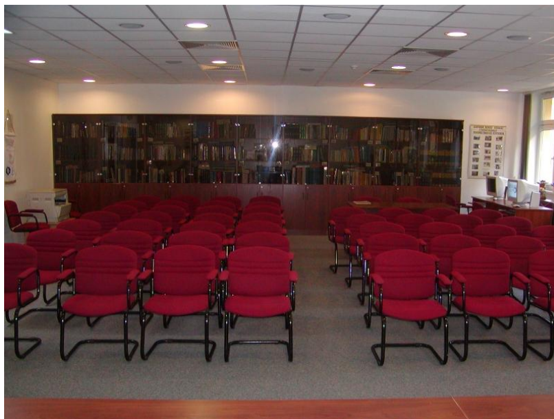
A fehérgyarmati orvosi könyvtár új helyisége

A kilencvenes években a könyvtár átmenetileg a kórház területén lévő, a helyiek által „kastély”-nak nevezett épületben kapott helyet. A jelenlegi, helyiségbe a 2000. évi kórház rekonstrukciót követően került a könyvtár. Az örvendetes esemény szépséghibája mindössze annyi, hogy ez az új épület második emeletén lévő könyvtár egyben konferenciaterem is, így a rendezvények idején lehetetlen a könyvtári munka.