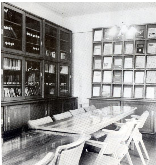
A mátészalkai kórház régi könyvtára

Az 1972-ben átadott 65 ágyas pavilon egy helyiségében valóban elhelyezték a könyvgyűjteményt, de rövidesen - az egyre több gyógyítási feladat miatt - az osztályok bővülni kényszerültek és a könyvtár innen is kiszorult.