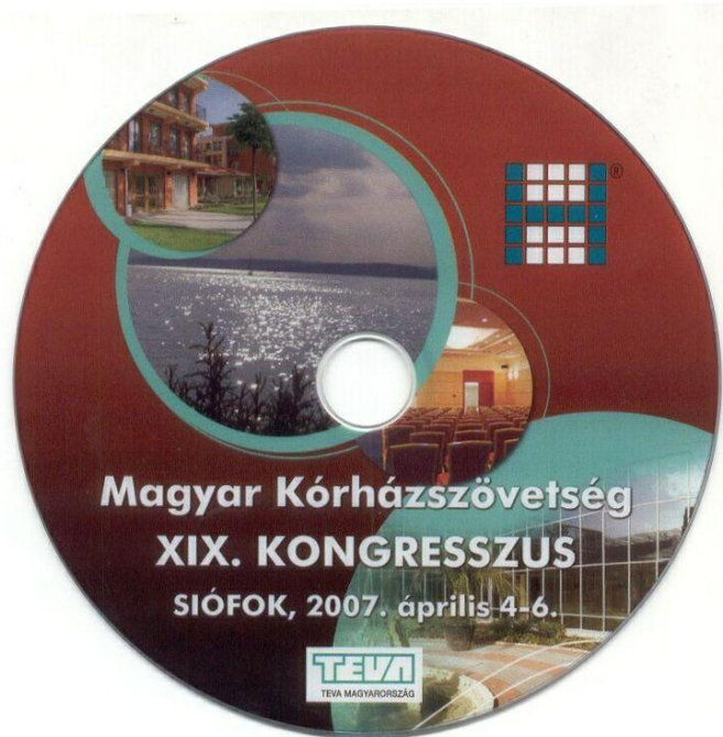
4. Abbildung: DVD-Kongressmaterial

seiner wichtigsten Gedanken werden projiziert. Eine solche Projizierung mit Schlagwörtern gibt aber nur sehr selten wieder, was eine inhaltliche Zusammenfassung leisten kann, obwohl die treue Vorstellung des Bildmaterials seine zweifelloste Tugend ist. Es gibt Beispiele dafür, das ganze Kongresse mit Videogerät aufgenommen werden und danach in DVD-Exemplaren herausgegeben werden. Aber das wird leider heutzutage sehr selten gemacht. (Abb. 4.)