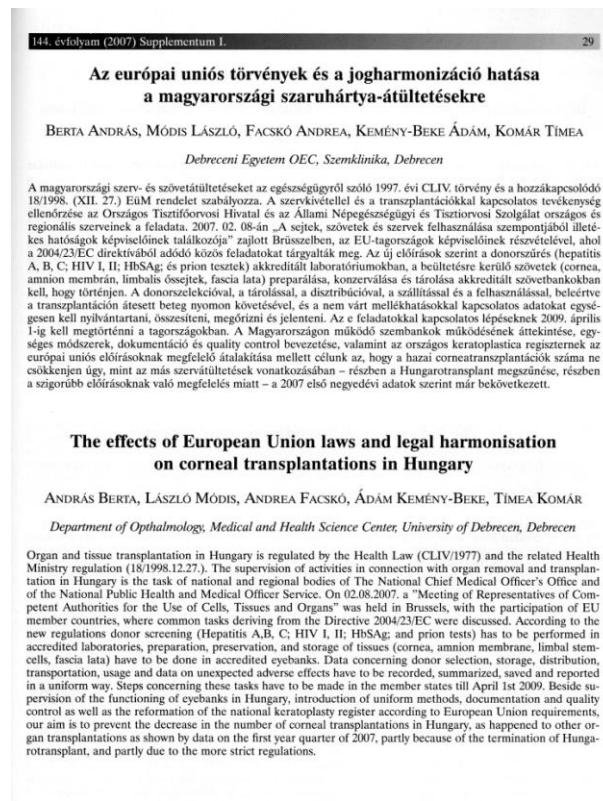
6. Abbildung: Zweisprachige Abstract in einem Supplementum-Heft

Die gutgemachten Kongress-Materialien, die mehrere hundert Vortagsmaterialien in sich haben, sogar in der Nationalsprache und/oder Englisch, sind mit Indexen versehen, so sind sie leicht benutzbar. (Abb. 6.)