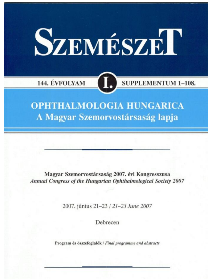
3. Abb. Ein Zeitschriftnummer mit Vorlesungszusammenfassungen

eigentliche, selbständige Sammlung: ein Buch, Jahrbuch oder Heft mit vollem Text und Abstrakten der Vorlesungen wird in der Veranstaltung nachfolgend mit beschränkter Exemplarzahl für wenige Interessierenden ediziert. Diese Form war eher früher verbreitet, in unseren Tagen wurde ihre Rolle wegen ihrer Langwierigkeit und Kostbarkeit von den Zeitschriften übernommen, die sogar in Form eines Supplementum-Heftes die Publikation der gesamten Fachmaterial der dort vorgelesenen Vorträge übernimmt. (Abb. 3.)